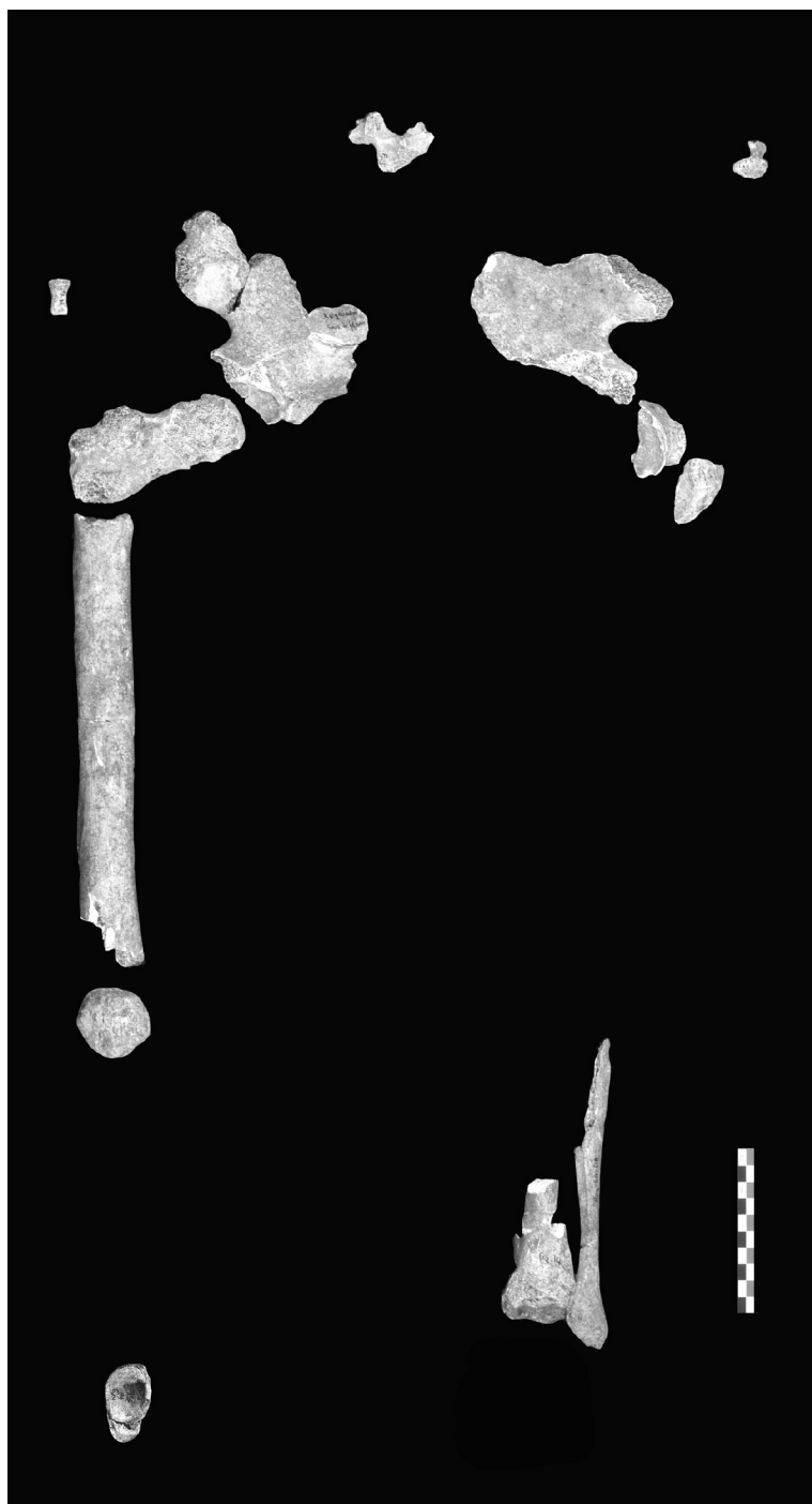
Figure 3 - Les nouveaux restes humains retrouvés dans les collections de faune de Regourdou.